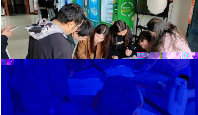
图 卓越团队建设共识营