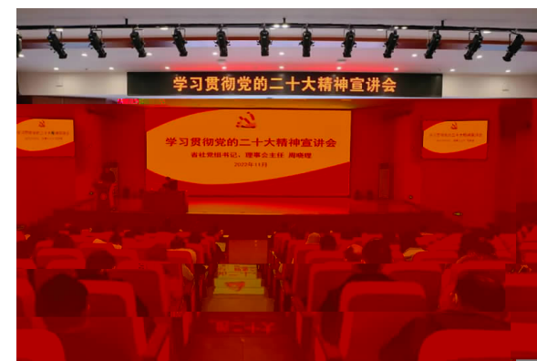
11月30 省 讲 精神 晓 来 湖南 精

入好 往努 沟通桥梁 注 呼声解 困难 依法 达诉 据悉 2021年 收 案 涉 利 施 均相 部 牵 研 10 案 也将 年 逐 答 (通讯 易婧 摄影 欣